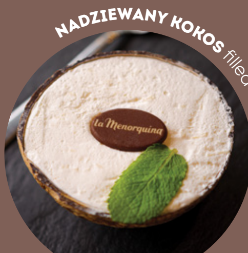
NADZIEWANY KOKOS filled coconut 26.90