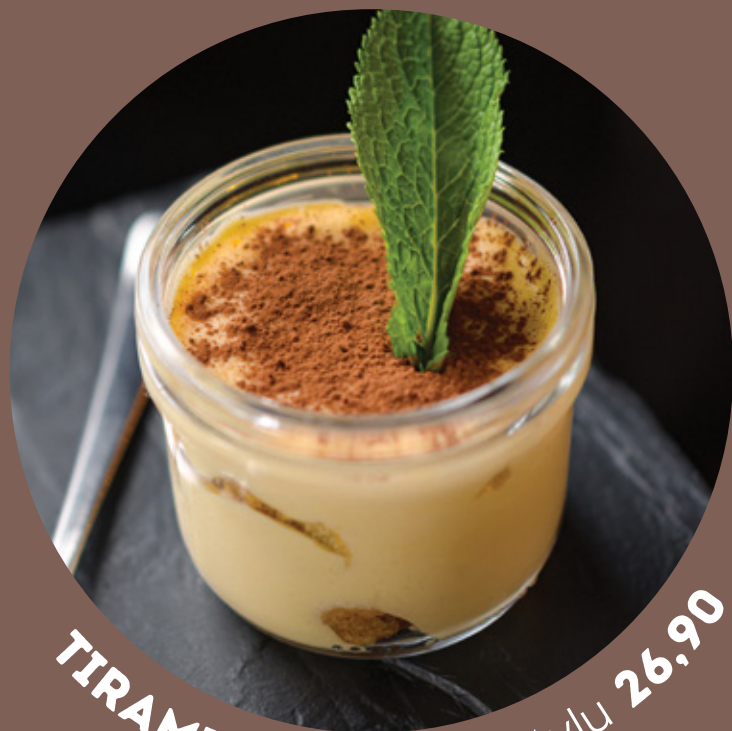
TIRAMISU v českém stylu 26.90

yogurt ice cream with forest fruit sauce, with the addition of blueberries, raspberries and currants