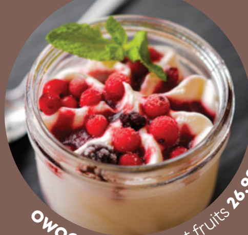
OWOCE LEŚNE forest fruits 26.90

lody jogurtowe z sosem z owoców leśnych, z dodatkiem jagód, malin i porzeczek