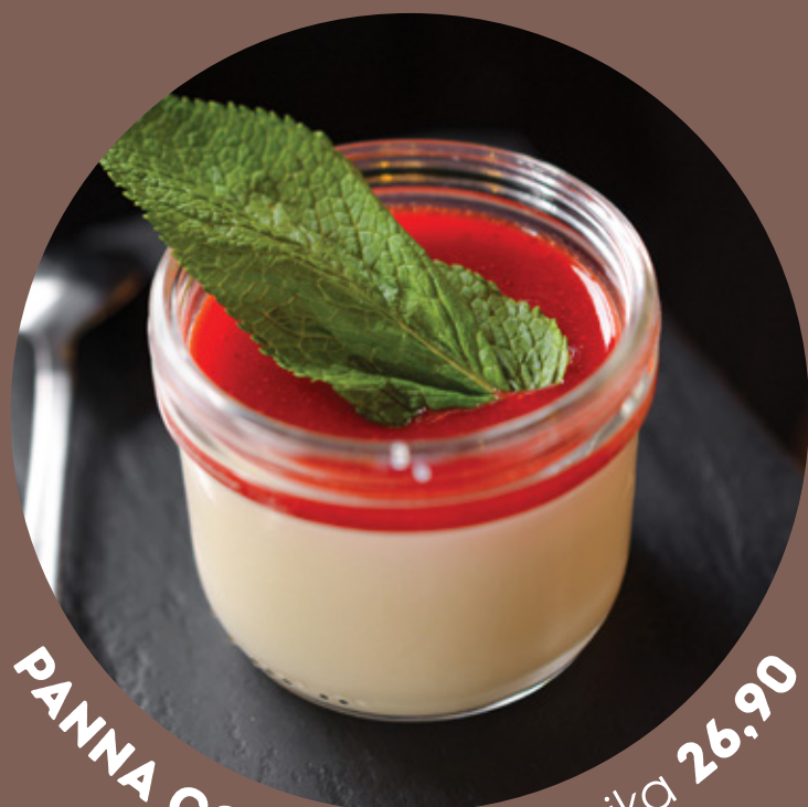
PANNA COTTA italská klasika 26.90

coconut ice cream with coconut flakes in a coconut shell