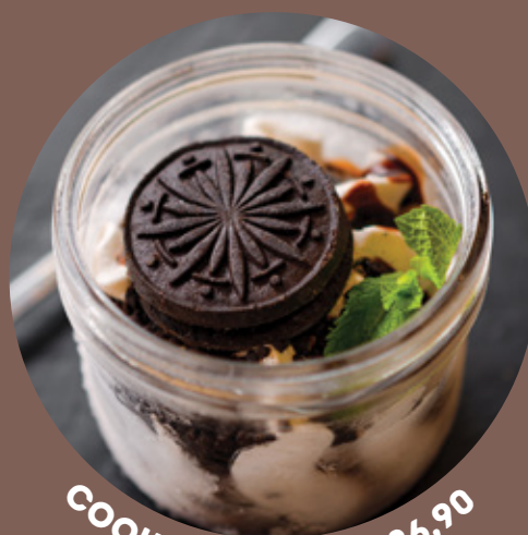
COOKIES & CREAM 26.90

kremowe lody z kawałkami ciemnych ciasteczek