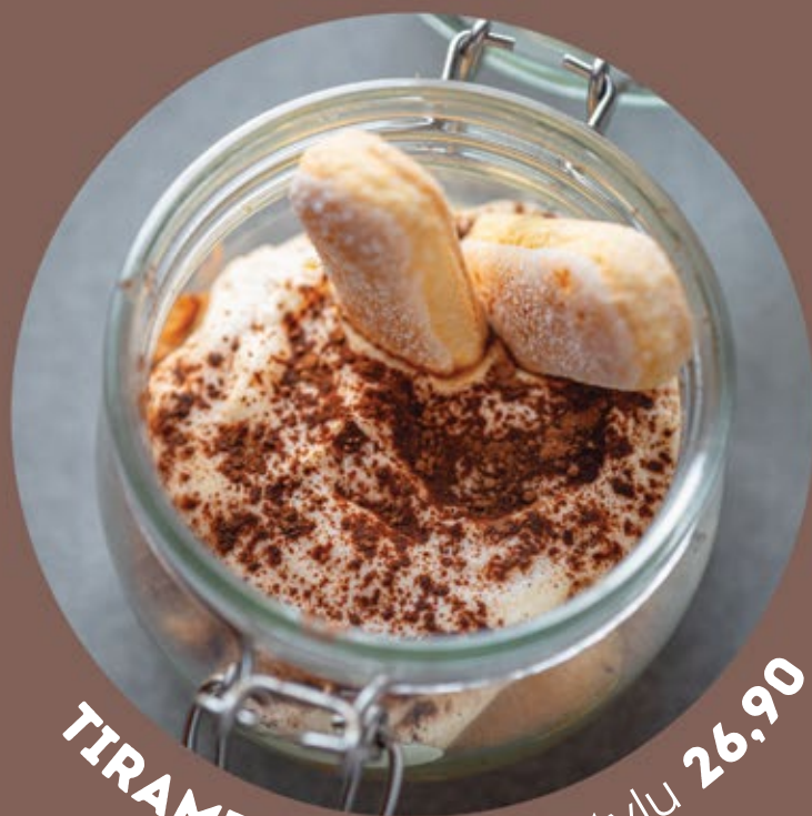
TIRAMISU v českém stylu 26,90