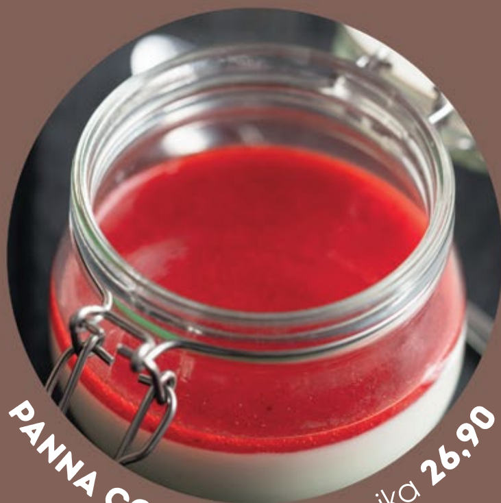
PANNA COTTA italská klasika 26,90